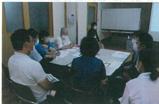
▲グループワークの様子