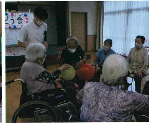
▲ふうせんを隣へ渡して早く一周したチームが勝利