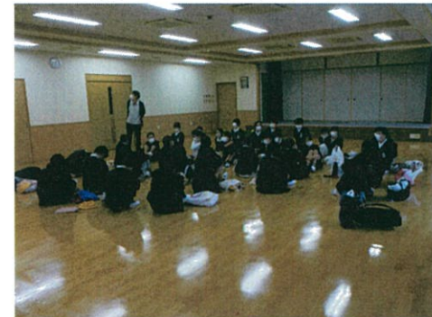
▲職員による施設の説明の様子