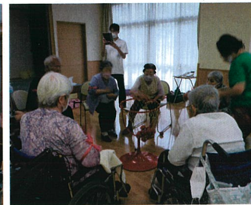
▲紅組白組対抗玉入れ♪