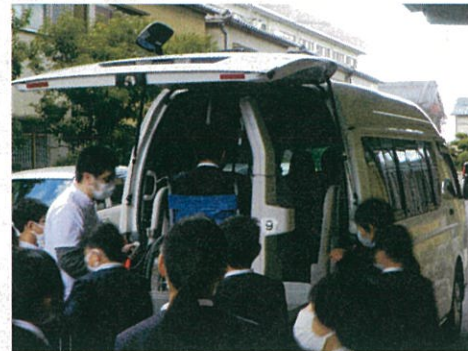
▲福祉車両のリフト体験