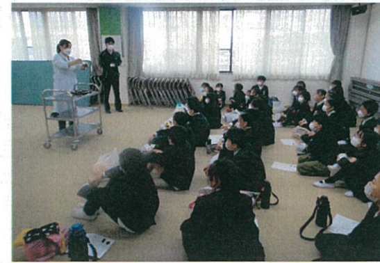
▲栄養士による食事の説明