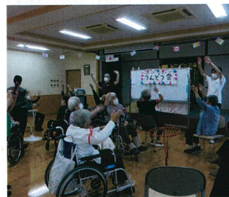
▲まずはみんなで準備体操!

かなはし苑デイサービスにて2日間運動会を行いました。白チーム、赤チームに分かれて、玉入れ、ボール回し競争をしました。皆さん一生懸命取り組まれ、喜ばれたり悔しがったり、さまざまな表情が見られました。職員も一緒に盛り上がり、笑顔あふれる楽しい時間となりました。