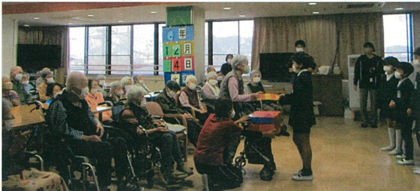
▲施設よりノートを贈呈